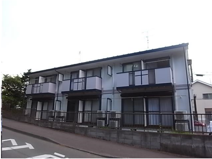
■ 「ウィン青葉」 外観写真